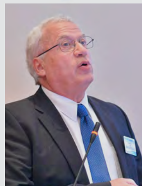
Shimon Tal, Form. Israeli Water Commissioner & Form. President of Israel Water Association, National & International Water Issues Expert

Στο συνέδριο παραβρέθηκαν υψηλόβαθμα στελέχη επιχειρήσεων των μεταποιητικών και βιομηχανικών κλάδων, εταιρειών παραγωγής αναψυκτικών και ποτών, εκπροσώποι της κυβέρνησης και της τοπικής αυτοδιοίκησης, εταιρειών διαχείρισης δικτύων ύδρευσης & αποχέτευσης, εταιρειών διαχείρισης και αξιοποίησης υδάτινων πόρων, προμηθευτές υπηρεσιών & τεχνολογικών λύσεων κ.ά.